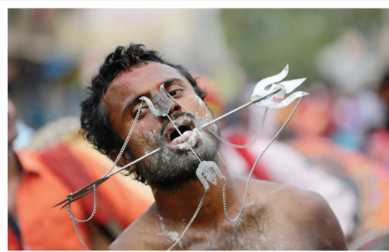
Calcutta Un participant à la procession en faveur de la déesse Maha Mariamman.