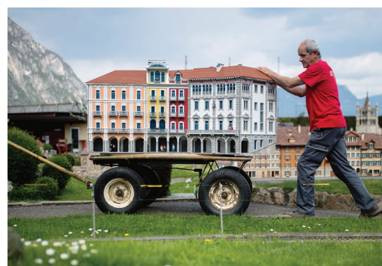
Melide Mise en place de la Piazza Grande de Locarno à Swissminiatur.