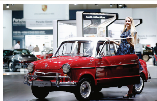
Essen Une NSU Prinz 30 en vedette d'une expo sur les voitures anciennes.